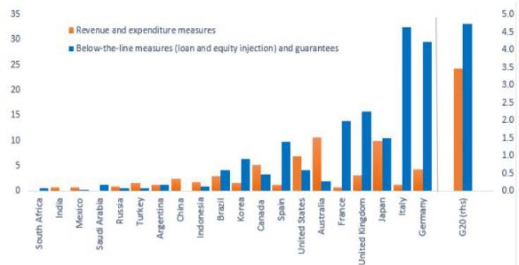
(Announced fiscal measures in G20 economies, % of GDP)